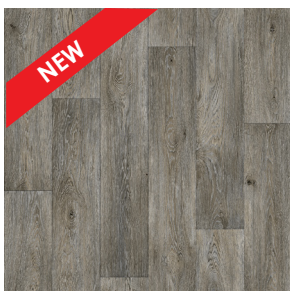
Aged Oak 967M