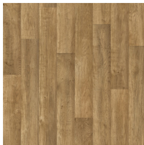
Coney Boardwalk Oak 006M