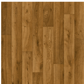
Coney Honey Oak 266M