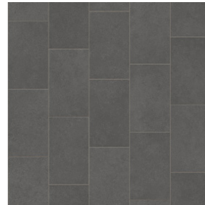
Metro Granite 900D