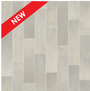
Celina Tile 109M